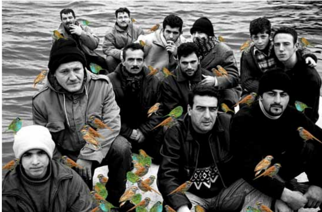
Şükran Moral, Despair, 2003 100x150cm Digital C-print