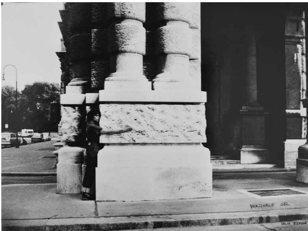
VALIE EXPORT, Vertikal Gel, 1976 Körperkonfiguration/Body Configuration series Vintage Baskı/Vintage Print 41.6 x 60.7 cm, Ed. 2/3 Signed recto