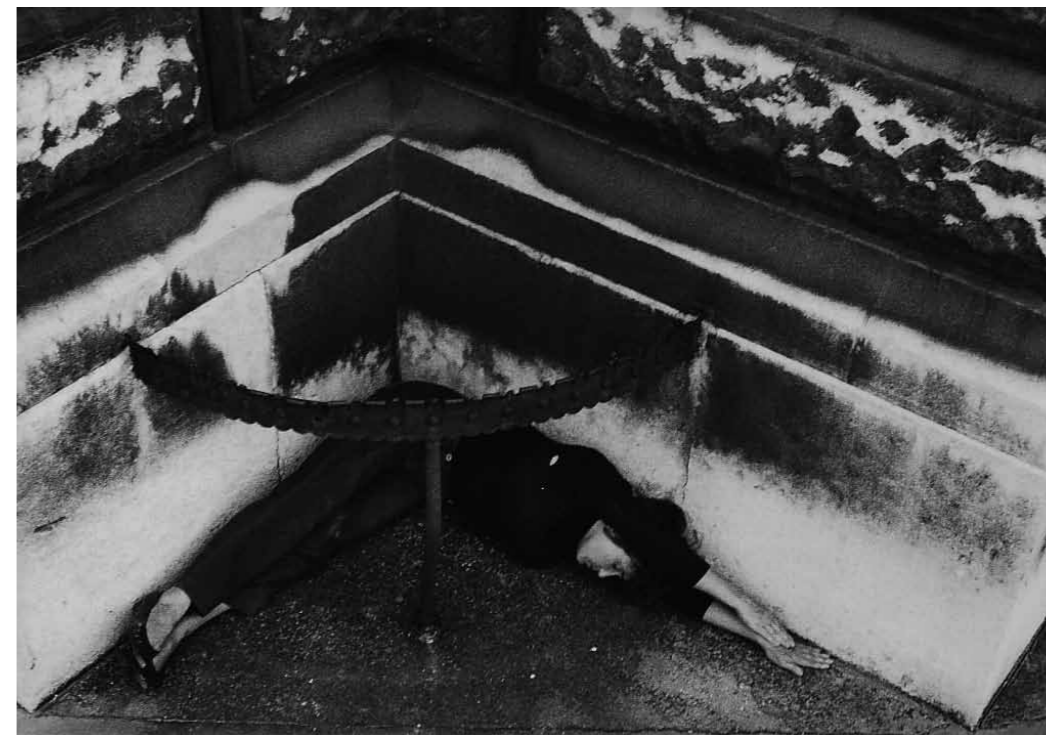
VALIE EXPORT, Dreieck mit Bogen, 1982 Körperkonfiguration/Body Configuration series Siyah Beyaz Fotoğraf/B&W Photograph 25.8 x 191.5 cm, Unique Signed verso