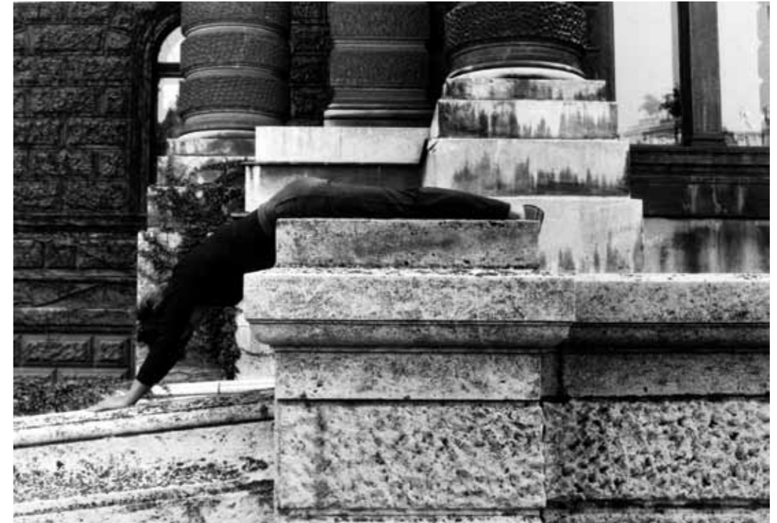
VALIE EXPORT, Justizpalast #4, 1982 124.5 x 184.5 cm, Unique Körperkonfiguration/Body Configuration series Siyah Beyaz Fotoğraf/B&W Photograph Signed verso